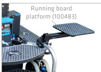
Running board platform (100483)

Running board platform: place anywhere you want for more space e. g. for accessories