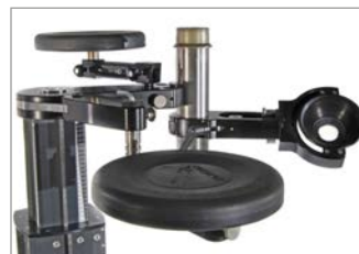
second seat for e.g. camera assistant