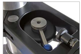
integrated flat clamp screw for fluid heads