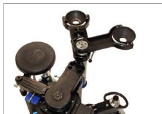
2 cameras mountable for e.g. 3D Shots