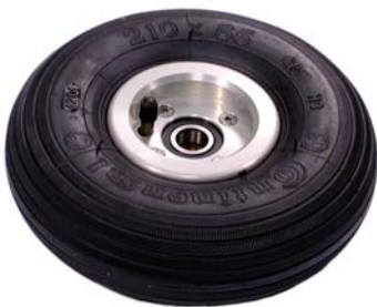
H-Pneumatic wheel with brake disc Payload: 200 kg / 450 lbs (138802)

Sie können zwischen verschiedenen Luft- und Studiorädern wählen: