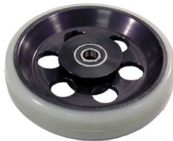
H-Studio wheel (soft) with brake disc Payload: 350 kg / 780 lbs (138843)