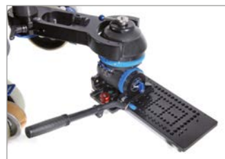
shots near to the ground possible (Lowshot plate needed - 107104)