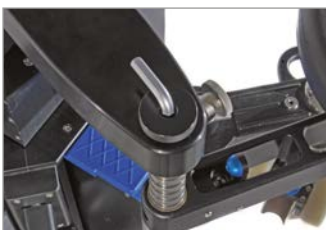
integrated allen key