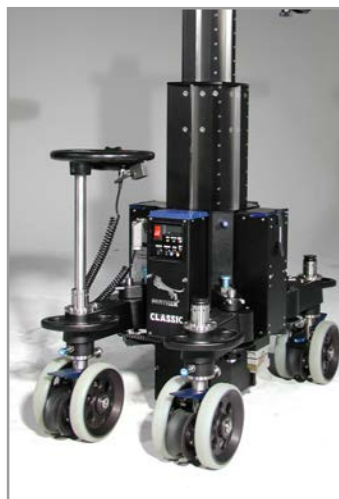
narrow gauge (36cm)

Das Arbeiten wird durch das ergonomische Design erheblich erleichtert. Umbauten können komplett ohne Werkzeug durchgeführt werden. So kann der Classic Plus sowohl in Schmalspur (36 cm) als auch in Breitspur (62 cm) durch Ziehen eines Rastbolzens bedient werden.