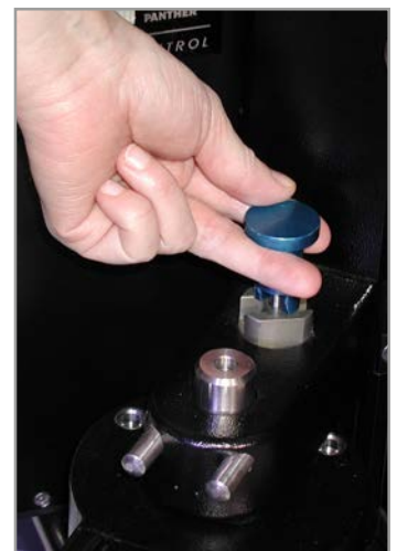
coloured control elements