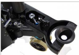
75-150mm bowl or mitchell