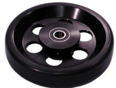
H-Studio wheel (hard) with brake disc Payload: 600 kg / 1330 lbs (143200)