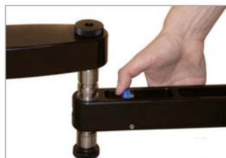
very comfortable seat adjustment via a button