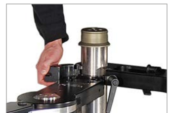
fast and tool free change between High Shot and Low Shot (also with mounted camera)

learn more about the High-Low Turnstile on separate brochure or at www.panther.tv